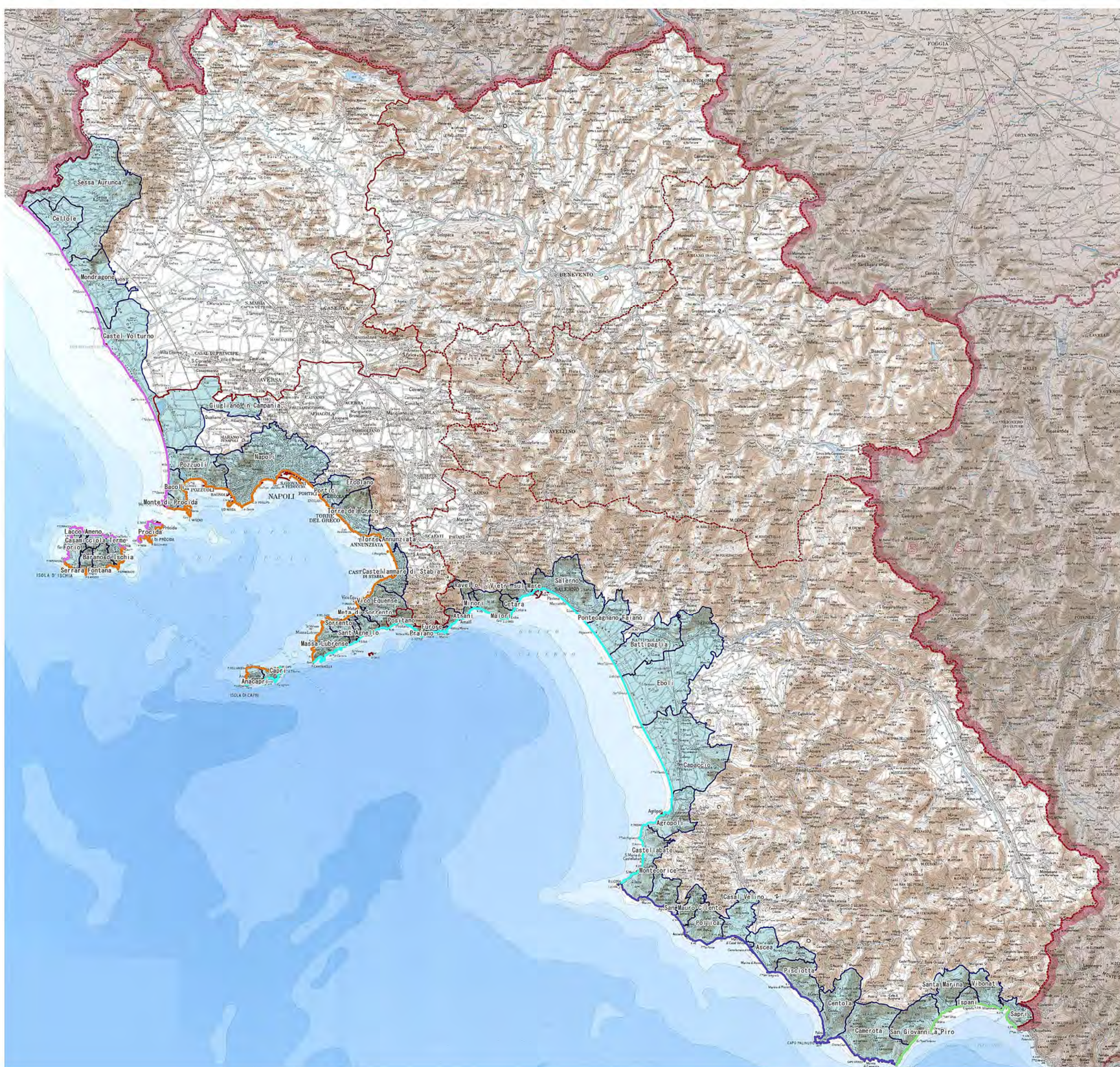
Tavola 02: Macro-Unità Fisiografiche costiere