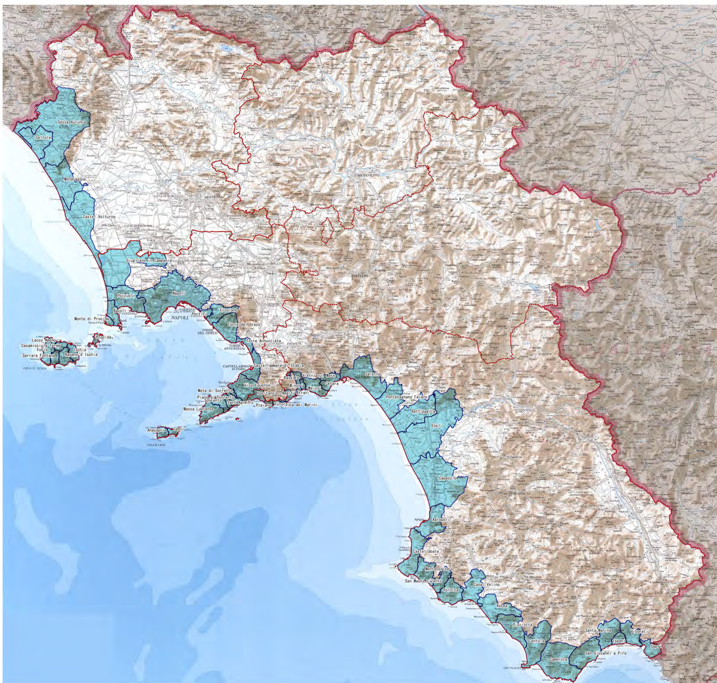
Tavola 01: Fascia costiera